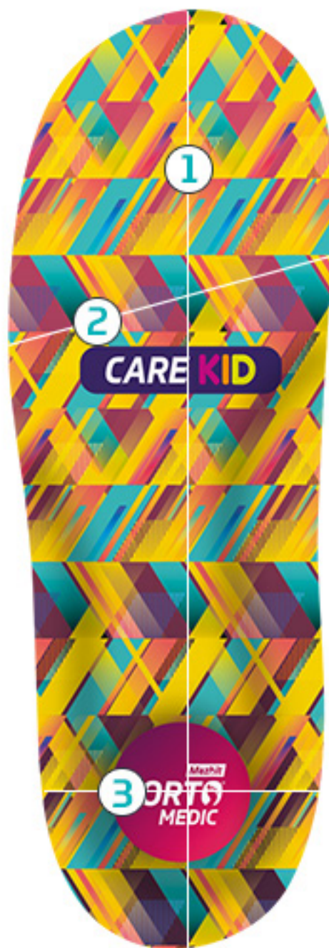
TABELA ROZMIARÓW PRODUKTU CARE KID (SPACE)