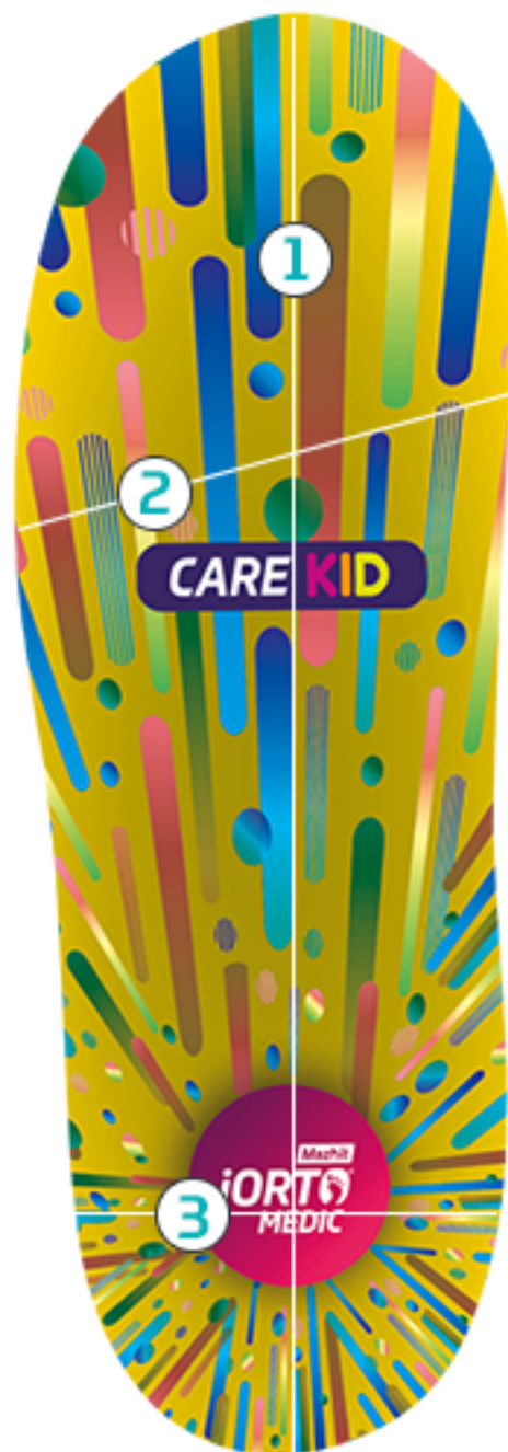
TABELA ROZMIARÓW PRODUKTU CARE KID (STANDARD)