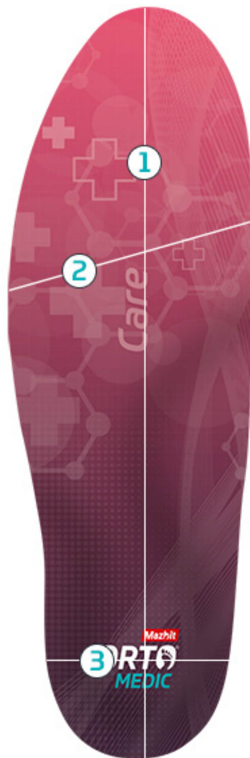
TABELA ROZMIARÓW PRODUKTU CARE (STANDARD)