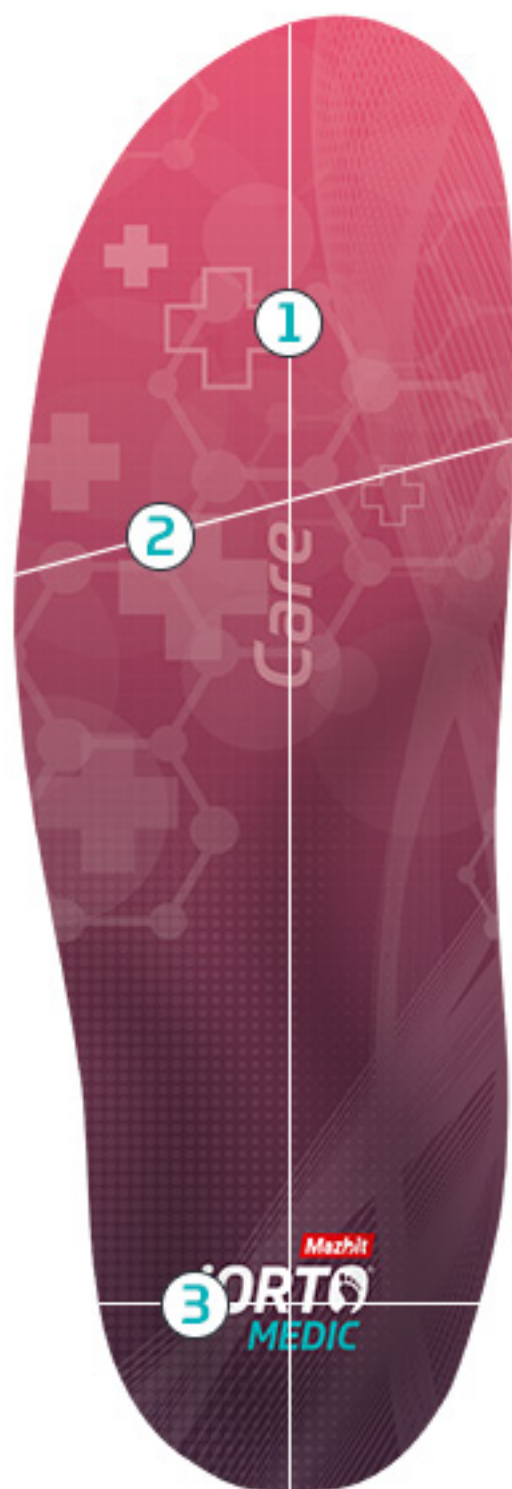
TABELA ROZMIARÓW PRODUKTU CARE (SPACE)