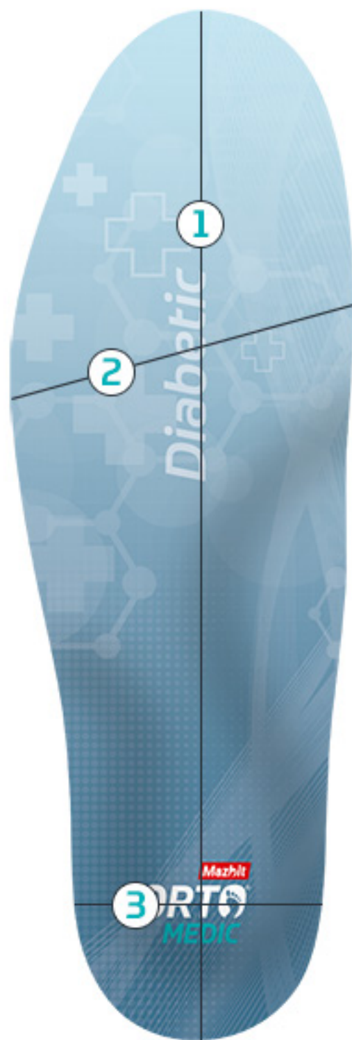
TABELA ROZMIARÓW PRODUKTU DIABETIC (STANDARD)