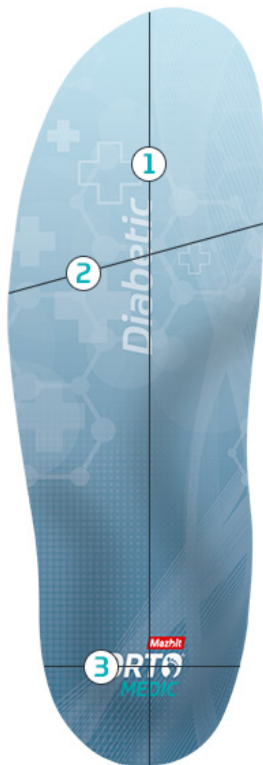
TABELA ROZMIARÓW PRODUKTU DIABETIC (SPACE)